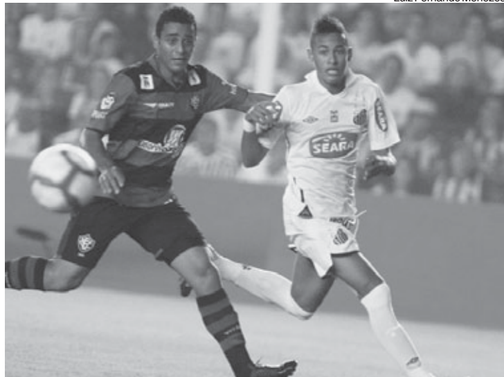
Alvo da cobiça Destaque no Santos e na seleção brasileira, Neymar pode definir seu futuro nesta semana