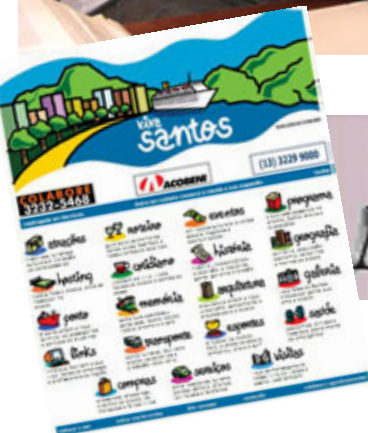
Jornal eletrônico Novo Milênio