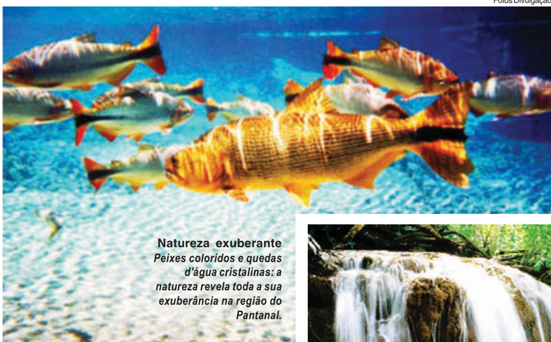
Natureza exuberante. Peixes coloridos e quedas d'água cristalinas: a natureza revela toda a sua exuberância na região do Pantanal.